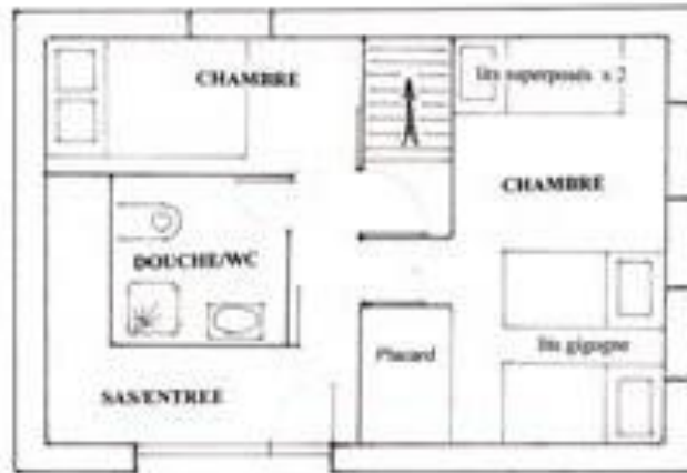
REZ DE CHAUSSEE